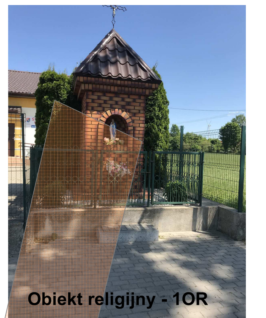
Obiekt religijny - 1OR

Projektant planu: mgr inż. arch. Jerzy Talaga Izba architektów PD- 0180 Białystok 2023.