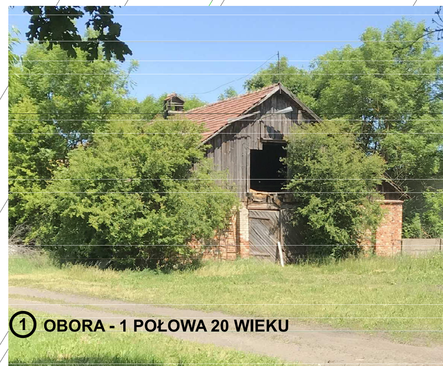
1 OBORA - 1 POŁOWA 20 WIEKU

Mapa zasadnicza w postaci wektorowej data wykonania kopii 2023-04-21 Licencja nr WG.6640.503_2023_2004_P