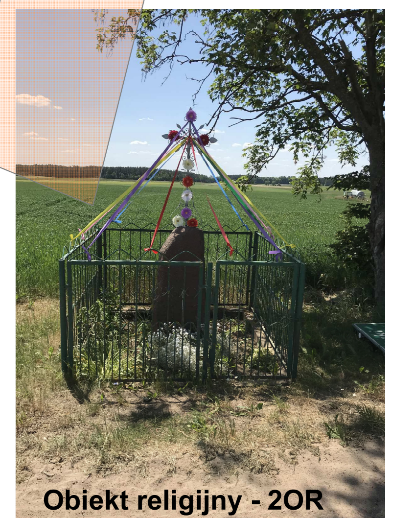
Obiekt religijny - 2OR