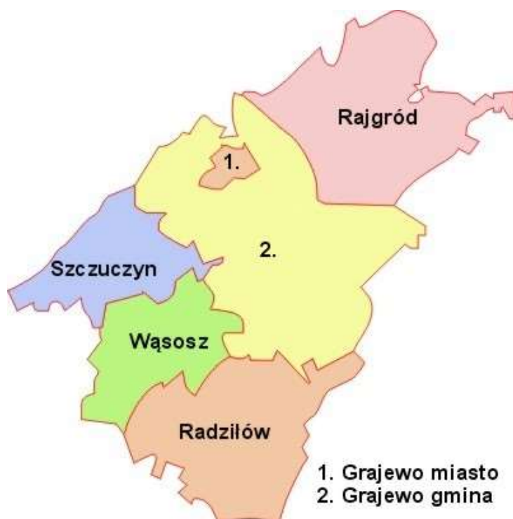
Rysunek 1. Granice administracyjne gminy Grajewo na tle powiatu grajewskiego.